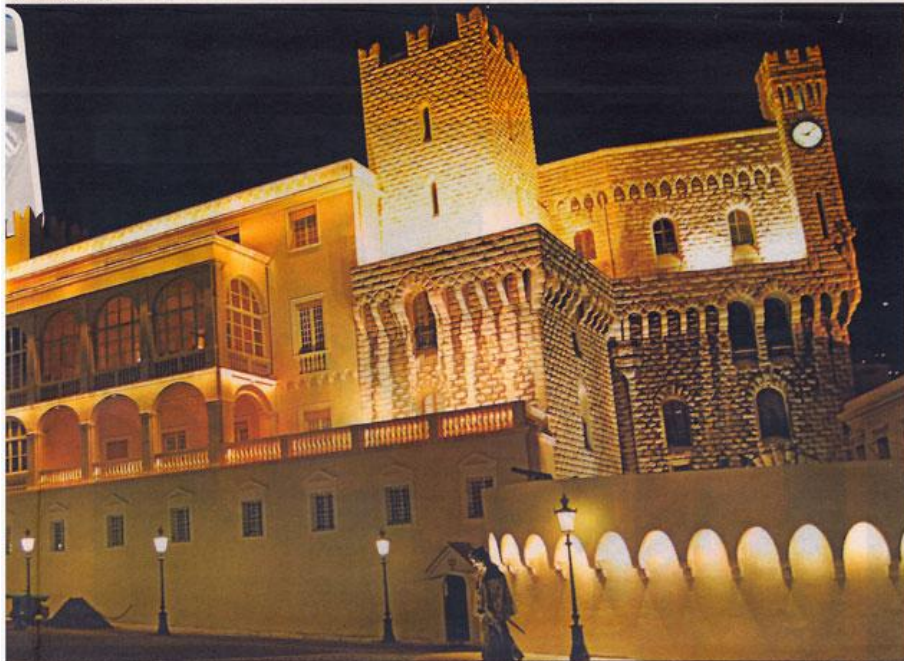
Το παλάτι του Μονακό τη νύχτα. Ενθέτες: Το σκετς της Σπύρου Κοντάκη και η πραγματικότητα Στεφανί