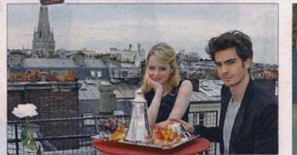
Η Εμα Στόουν και ο Αντριου Γκάρφιντ στη φωτογράφιση με την τσαγιέρα. Κέντρο: