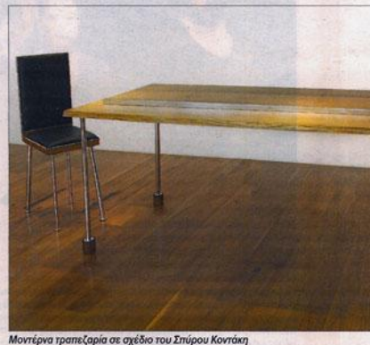
Μοντέρνα τραπεζαρία σε σχέδιο του Σπύρου Κοντάκη