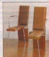
Πρωτότυπες δημιουργίες του Σπύρου Κοντάκη. Οι ιδιαίτερες καρέκλες και το περίεργο φωτιστικό